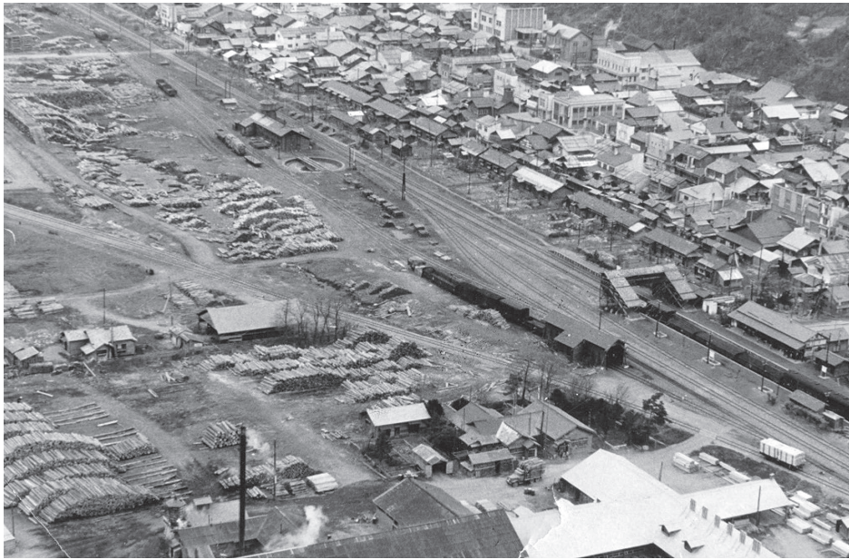
蒸気機関車の給水塔や転車台もみこれる

置戸に開拓の鍬が下ろされて120年余り。時代が進むにつれて市街地の町並みは変化していきました。その中で最も移り変わりが顕著なのはかつての駅土場の光景でしょう。