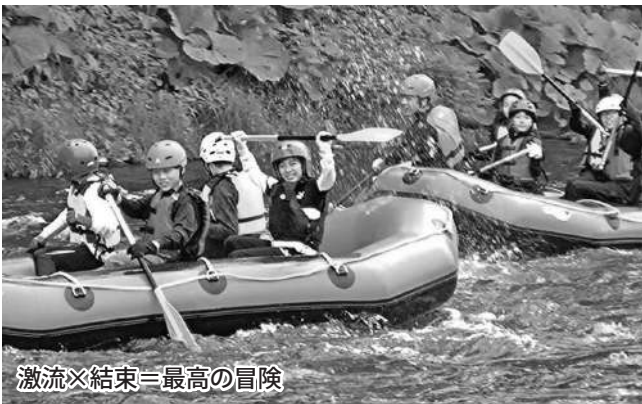
激流×結束＝最高の冒険