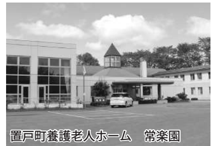
置戸町養護老人ホーム 常楽園