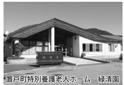
置戸町特別養護老人ホーム 緑清園