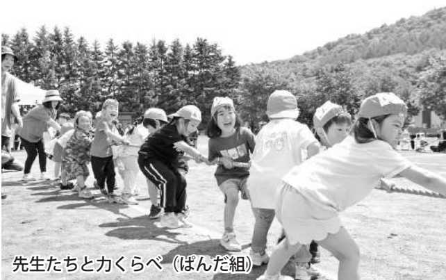
先生たちとかくらべ（ぼんだ組）