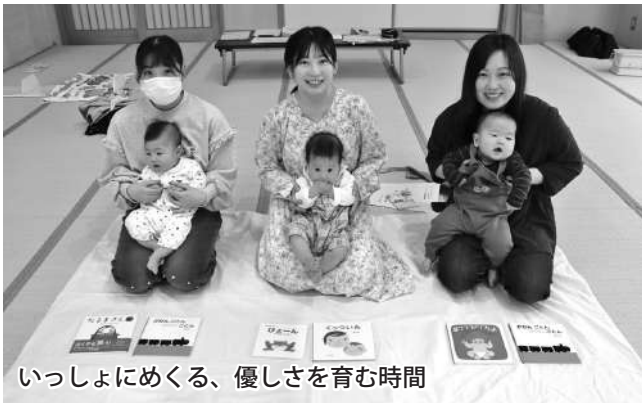
いっしょにめくる、優しさを育む時間