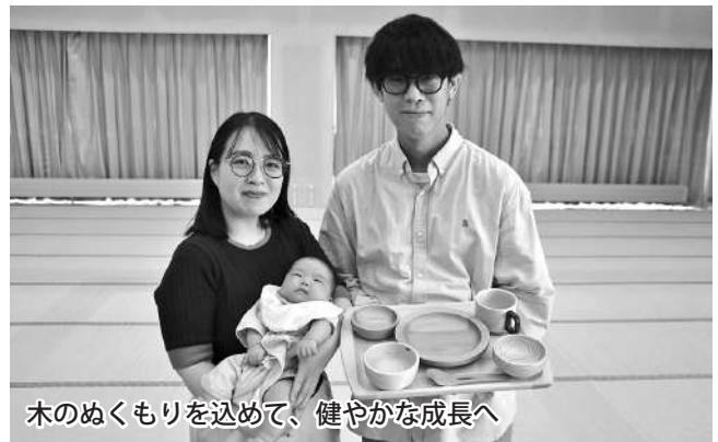
木のぬくもりを込めて、健やかな成長へ