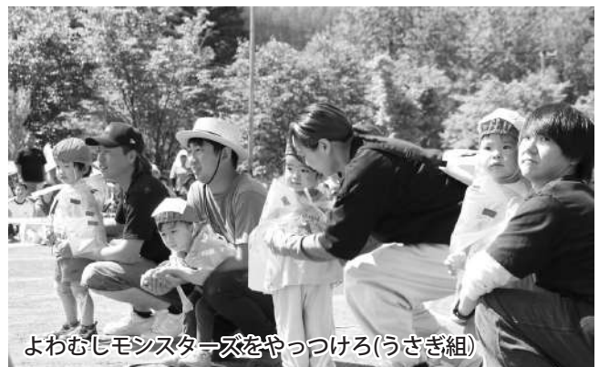
よわむじモンスターズをやっつけろ（うさぎ組）