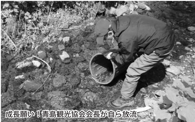
成長願い！青島観光協会会長が自ら放流