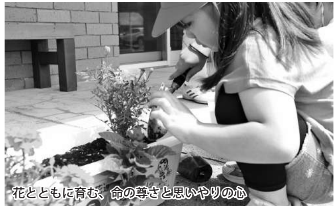
花とともに育む、命の尊さと思いやりの心