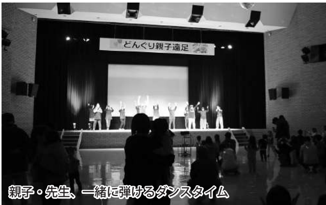
親子・先生、一緒に弾けるダンスタイム