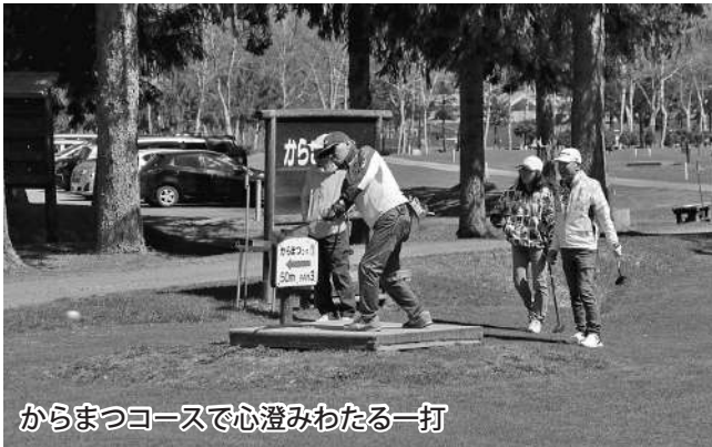
からまつコースで心澄みわたる一打