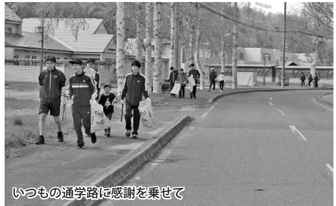
いつもの通学路に感謝を乗せて