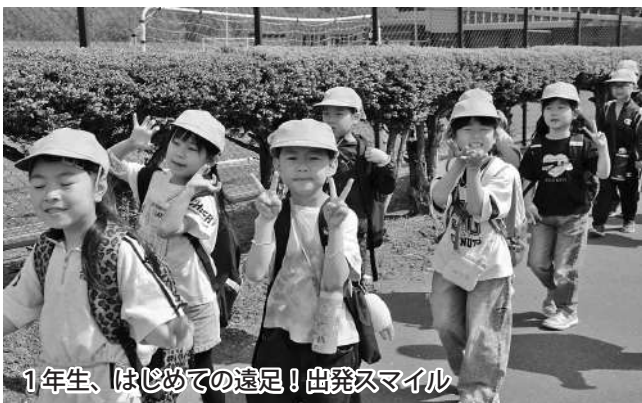
1年生、はじめての遠足！出発スマイル