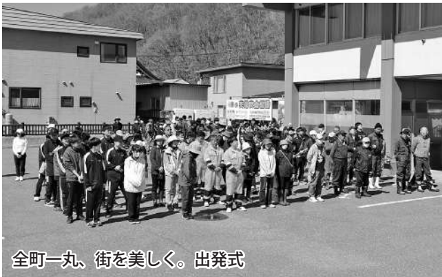
全町一丸、街を美しく。出発式