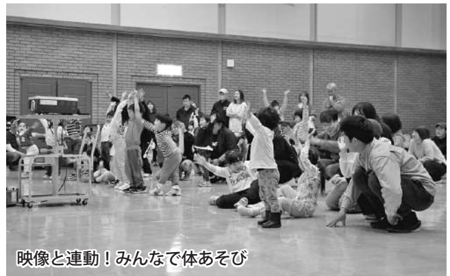
映像と連動！みんなで体あそび