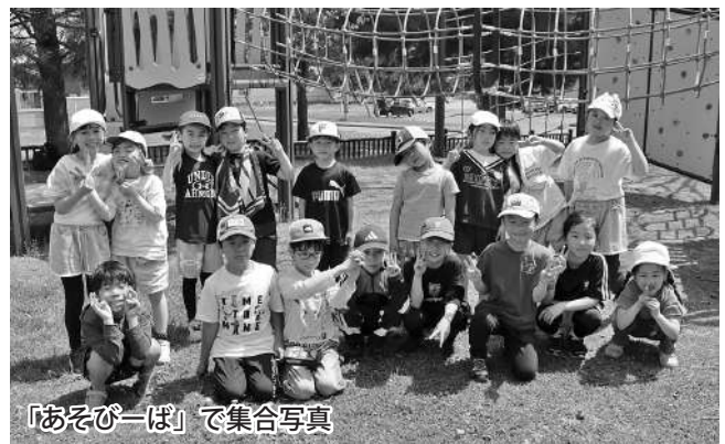
「あそびーば」で集合写真