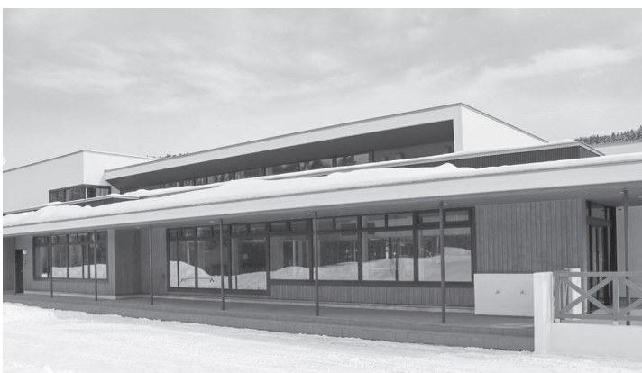
開設予定の児童館

の重要性が急務となっていることから、引き続き北海道教育委員会に要望していきます。また、管内を中心とした他中学校における説明会の確保、地元生徒の入学希望者の増など、積極的な生徒募集のための取り組みに支援を行い、高校の存続を図ります。 中央公民館事務室及び会議室、勝山公民館多目的ホールへのエアコン設置工事を行い、利用者の皆さんが快適に施設を利用できるように整備を進めます。