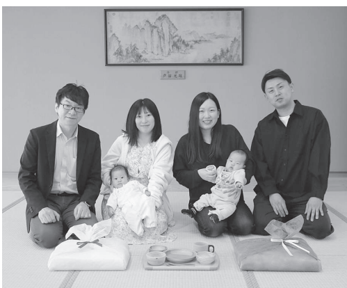
すくすくギフト贈呈式（2月27日）

どま工房では、秋岡コレクションの整理・活用を図るとともに、オケクラフトの基礎となる手仕事文化の情報発信に努めます。