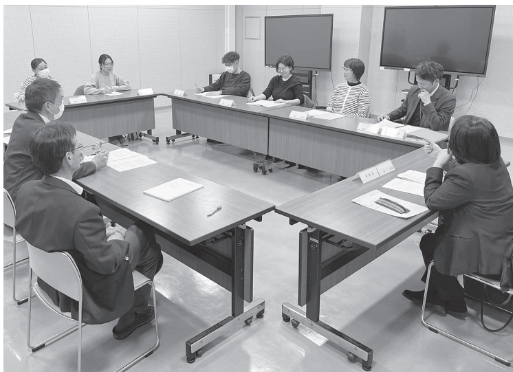
まちづくり基本条例委員会の様子

と議会と町の役割や責任を決めて、 町民が主役のまちづくりを進める ことを目的として、「まちづくり 基本条例」をまちづくりの一番大 切な決めごととして定めています。