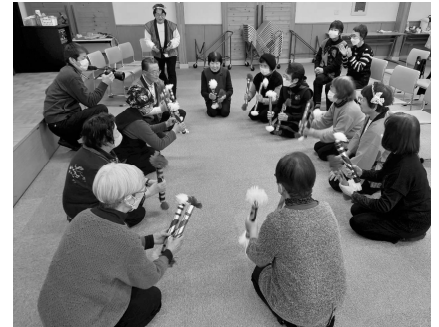
「秋田ドンパン節」体験の様子