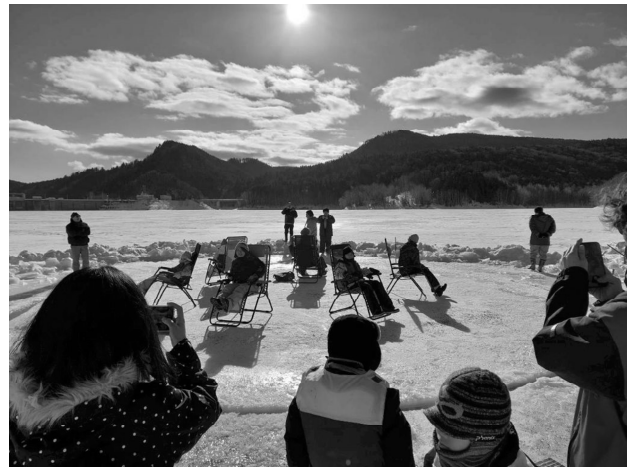
絶好の冬晴れの下おけと湖の大パノラマを堪能！

チェアに座りゆっくり流れる360度の冬のパノラマに参加者からは、「湖面を動く氷の上に乗れたのが新鮮！」「鹿ノ子ダムでこんな体験ができるなんて！」と歓声があがっていました。