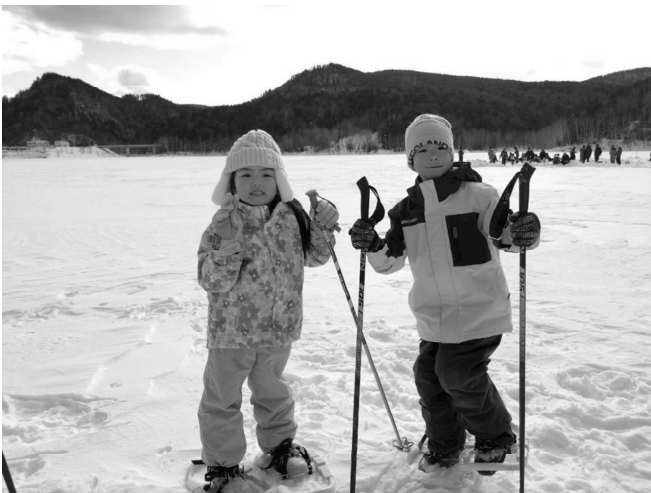
慣れてくると積もった雪の上でも体が沈まないよ！

「これはエゾシカが歩いた跡だよ」、「冬は餌が少ないから樹の皮を食べたみたいだね」などの説明を聞きながらスノーシューウォーキングを楽しみました。