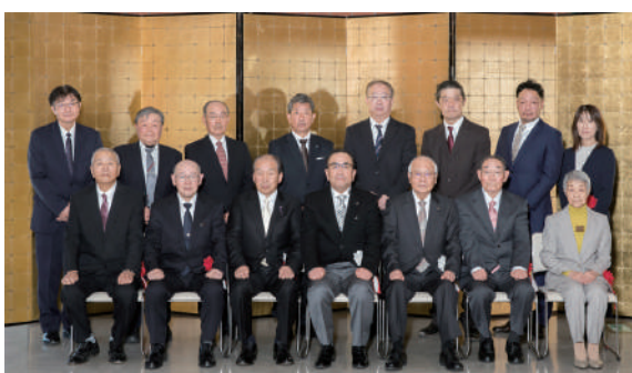
受賞者の記念撮影