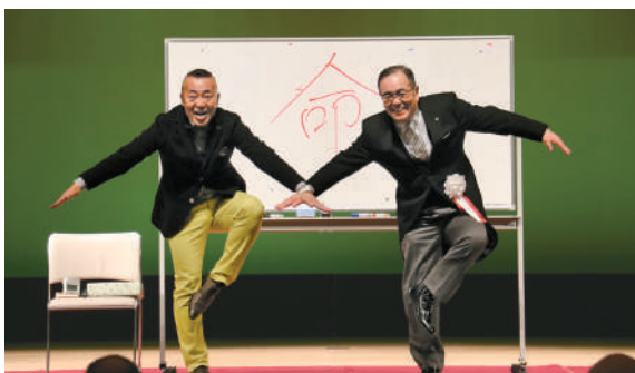
深川町長と一緒に「命」のポーズ