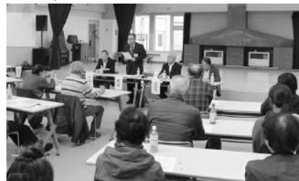
勝山地区移動町長室の様相