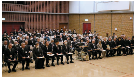
開町110周年記念式典の参会者