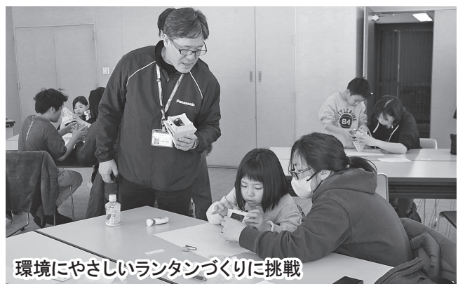
環境にやさしいランタンづくりに挑戦