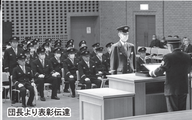
団長より表彰伝達