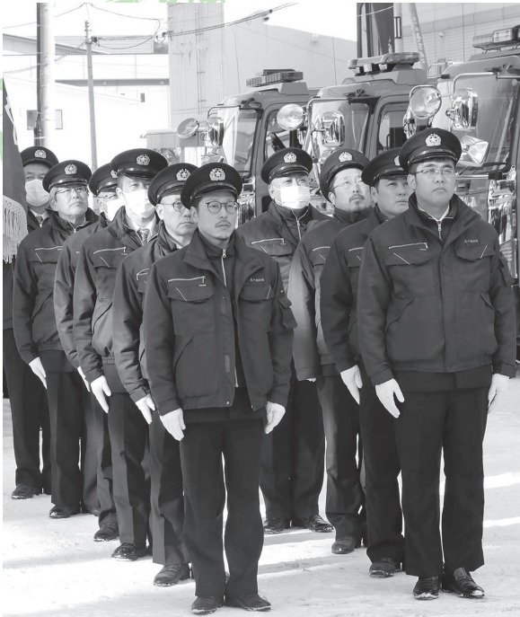
きびきびとした姿の消防団員