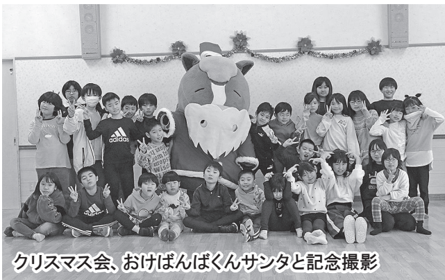
クリスマス会、おけばんぱくんサンタと記念撮影