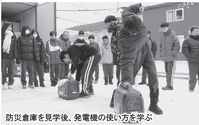
防災倉庫を見学後、発電機の使い方を学ぶ