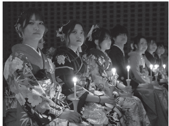
引き継いだ営火とともに成人としての社 会の役割を胸に誓う