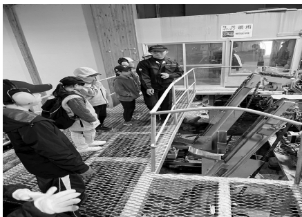
みんな真剣に説明を聞きました

今回ご協力いただいたウッディハウスおけとのみなさん、食材を提供していただいたみなさんに心より感謝いたします。ありがとうございました。次回、ふるさと少年クラブも楽しみましょう！