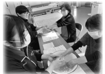
手も心もホッコリ(*^-^*)