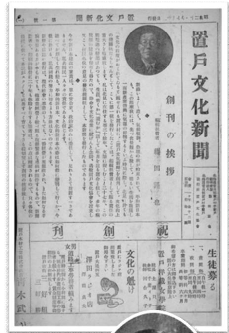
創刊号（昭和二十一年七月）