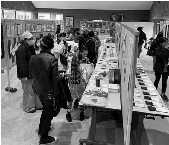
たくさんの作品が展示され賑わう中央公民館ロビー