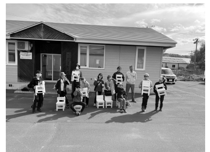
個性溢れる椅子が完成！