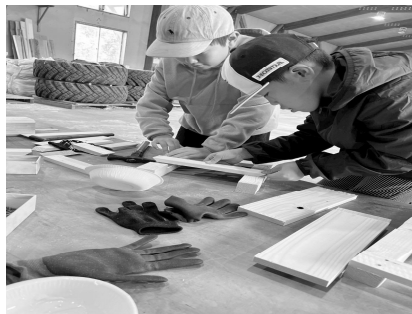
仲間と協力して椅子作り