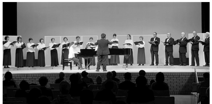
美しい歌声を披露してくれたコーラスサークルのみなさん

舞台発表は、14団体が出演。2年ぶりの登場となったウクレレサークルやフラダンスサークルが華やかな衣装で登場し、格調高い吟詠会の詩吟やギター、ヴァイオリンの音色も賑やかに会場を包みこみました。キッズダンスクラッピーのステージでは、かわいらしい子どもたちのダンスに会場からは大きな拍手が。また、開町100周年を記念した町民構成劇で劇中歌として作曲された「開拓の歌」は、コーラスサークルそよかぜのみなさんによる合唱曲として披露され、美しい歌声が懐かしさとともに会場を魅了していました。