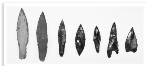
町内安住出土の石刃鏃 （左2つが頁岩、残り5つは黒曜石製）

石刃鏃は柳の葉のような細長い石器（＝石刃）から作られた矢じりで、素材の周縁部を押圧剥離によって形を整えているのが特徴的です。石刃そのものは旧石器時代から続く技術ですが、石刃鏃は約7千年から8千年前の縄文時代早期に多くみられ、東北アジアから技術が伝わったと考えられています。山や畑から出土する小さな石器でも、北海道と大陸文化のつながりを考える重要な石器となっているのは、考古学を研究するうえでとても興味深いところです。このような石器をお持ちの方はぜひ一度資料館までご一報ください。