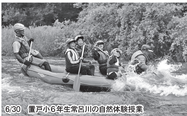
6/30 置戸小6年生常呂川の自然体験授業