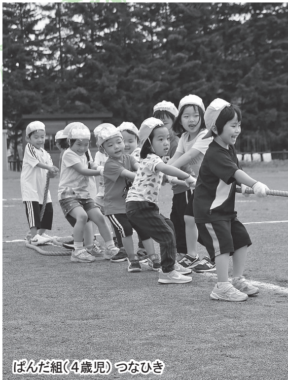
ぱんだ組(4歳児) つなひき