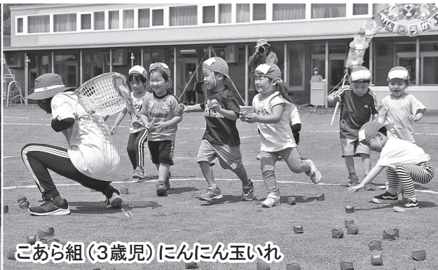
こあら組(3歳児) にんにん玉いれ