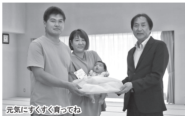
元気にすくすく育てね