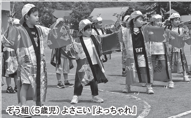
ぞう組(5歳児) よさこい『よっちゃれ』