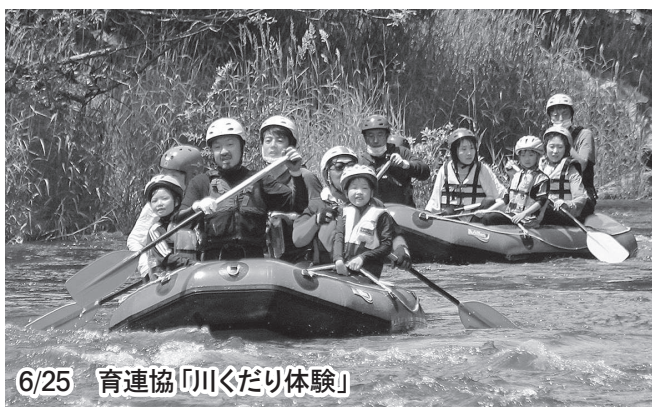
6/25 育連協「川くだり体験」