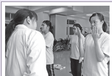
1. 講義の前に身だしなみをチェック!