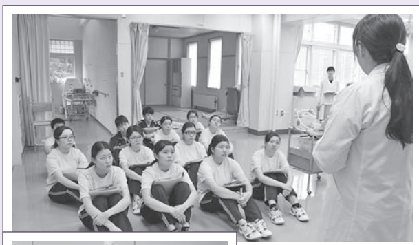
3. 実習室の片付けを終わった後、学習のまとめを行います。