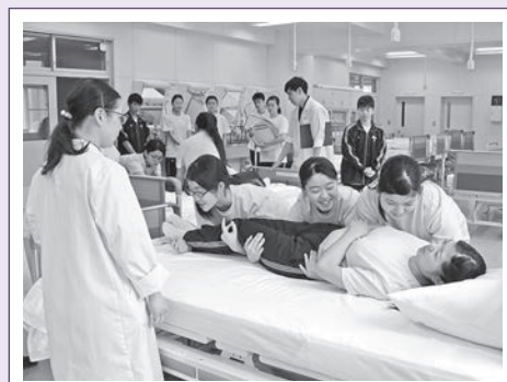
2. 手順を確認後、4人1組で、実習がスタート。先生が付き添い、指導します。利用者に不安感を与えないよう、「めまいはありませんか?」など声をかけながら介助します。