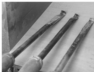
刃物は砥ぎが重要