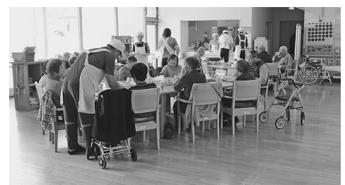
デイサービスの様子