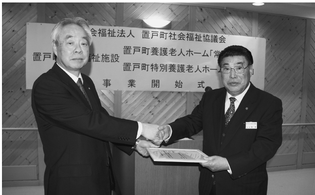
両老人ホームの管理運営を町社協へ委託

民生関係では、指定管理者制度の導入により、両老人ホームの管理運営を置戸町社会福祉協議会へ移行することから、移行後の運営体制を支援するため、老人福祉施設指定管理委託料として5,977万円を計上しました。公共交通機関等の利用による町外への通院が困難な高齢者に対して、介護タクシー等の通院交通費助成のため200万円を計上しました。