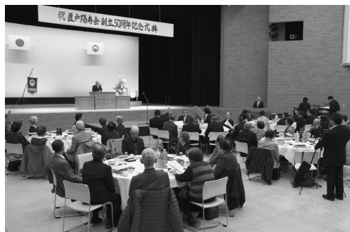
置戸陽寿会創立50周年記念式典の様子 ＝ 3月24日、中央公民館にて

置戸に老人クラブが発足したのは、「高齢者同士お茶でも飲みながら話し合える場所がほしい」との声を受け、昭和34年に中央公民館事業として「一日老人ホーム」が開設されたことがきっかけです。第一回の6月10日には、和室に、碁、将棋、花札、浪曲スライドなどが用意され、参加したおよそ30人の高齢者が娯楽を楽しみ、親睦を深めました。その後、毎月10日を「一日老人ホーム」と定め、置戸地区の単位婦人会員が交替でお世話役をつとめていました。