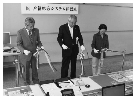
戸籍事務の電算化がスタート