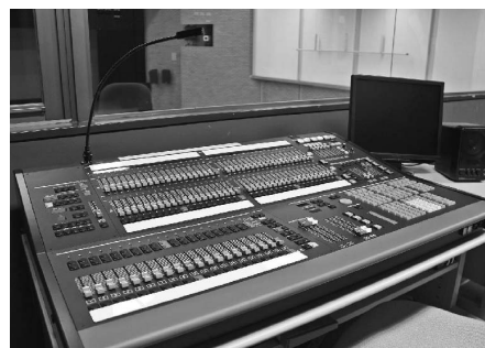
中央公民館の音響・照明設備を一新