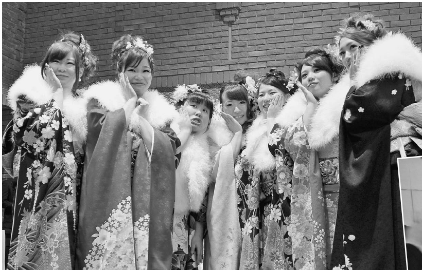
華やかな振り袖に身を包んだ新成人