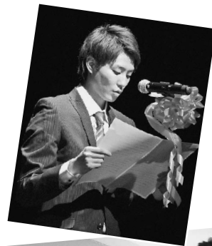
今伝えたい思いを 朗読で紹介