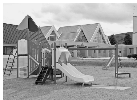
勝山公民館前に 複合遊具を設置