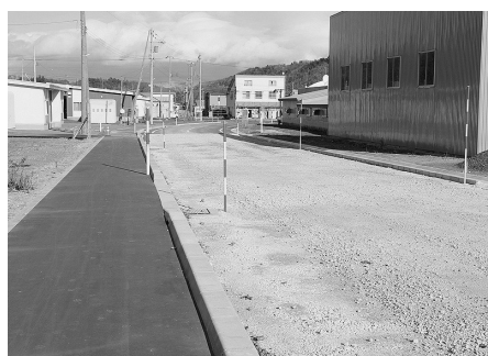
改良された町道生涯学習 情報センター通り線