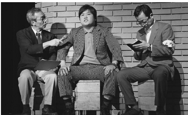
人間ばん馬誕生物語