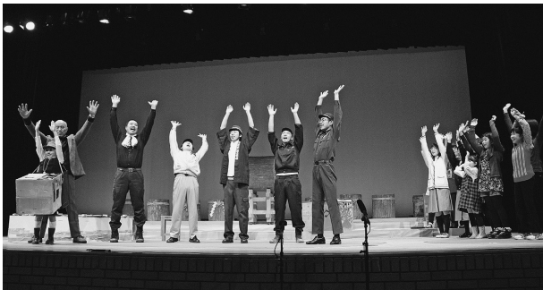
勝山 森林鉄道ありがとう