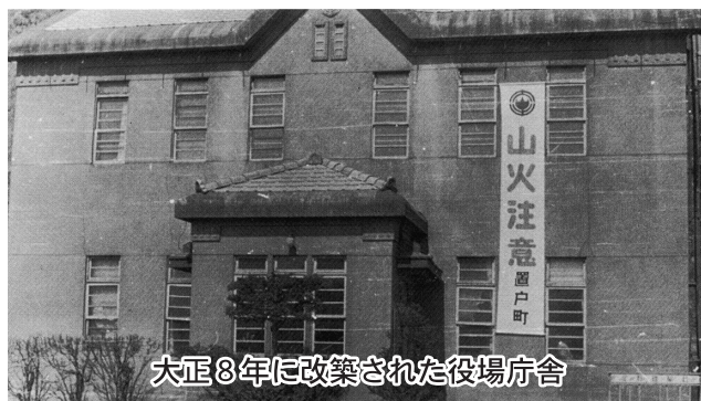
大正8年に改築された役場庁舎