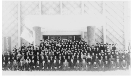
昭和34年の成人式には約150人が出席しました

終戦の昭和20年から22年と、三井木材置戸工場閉鎖の頃の同41年から42年が1万人台、1万1千人台が町制施行頃の同23年から27年と老人ホームが出来た頃の同39年から40年、1万2千人台が台風15号による風倒木発生から処理の同28年から農業構造改善事業の始まった38年までですが、この間同34年から35年の2年間のみ1万3千人を少し上回りました。同35年を頂点に置戸の人口は下降線をたどり、以降上昇に転じたことはありません。同35年は風倒木処理も終わり、世は前年から入った岩戸景気で他に職を求めて去る人もぼつぼつ出てきた頃でしたが、1万3千人になったこと自体が異常で、人力に頼る風倒木処理に全国各地から