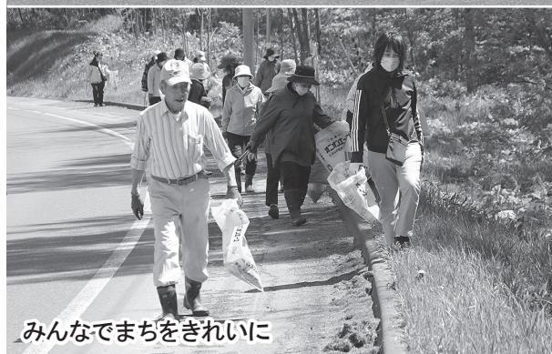
みんなでまちをきれいに