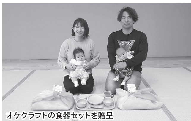
オケクラフトの食器セットを贈呈