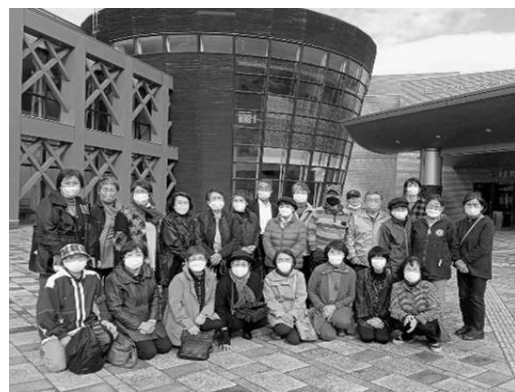
日帰り研修旅行 遠軽町埋蔵文化財センター