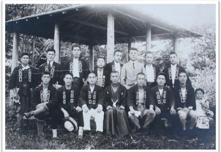
青木榿工場の職人たち 勝山神社の東屋にて

屋根榿はトタン屋根に代わり需要が減ったことで職人もいなくなりましたが、当時の置戸の産業を支えた職人たちを写す貴重な写真です。