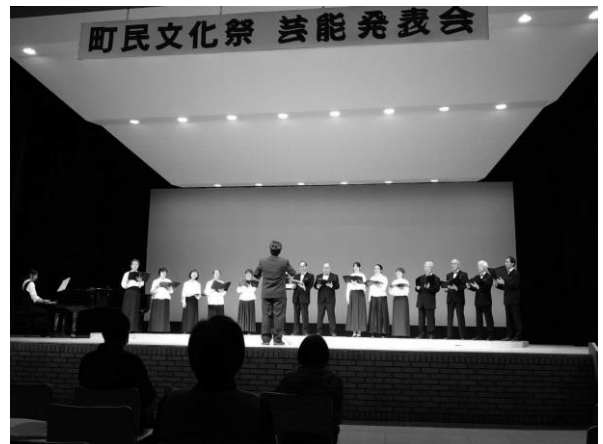
4年ぶりの出演となったコーラスサークル「そよかぜ」

また、公民館では様々な文化団体やサークル活動が行われていますが、今後も様々な教室や講座の機会を提供していくなかで、第2、第3の新規団体が誕生し、来年度の文化祭への出展・出演を期待しています。