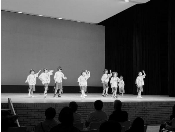
キッズダンス「クラッピー おけとチーム」

10月17日(火)から開催された第47回町民文化祭が11月3日(金・祝)に閉幕しました。開催期間中の3日には芸能発表会(舞台発表の部)を開催し、公民館等で活動している14団体が日頃の練習の成果を披露し観衆を魅了しました。