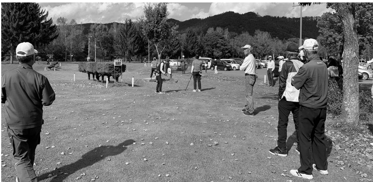
【女子の部のプレーオフ。静寂が包む場内に緊張が走っている中での1枚】