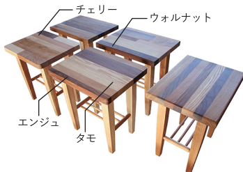
チェリー ウォルナット エンジュ タモ

先月まで「木に親しむ日」の連動企画として、様々な「はぎ合わせ」の方法についてご紹介してきました。今月は作品の完成報告と合わせて、参加者の皆さんに人気の高かった樹種の特徴を紹介していきます! 【タモ】国産材。別種アオダモは野球のバットの材として使用される。 【ウォルナット】外国産材。クルミ科に属し、高級家具材として利用される人気の高い樹種! 三大銘木 【チェリー】外国産材。桃色がかったキレイな色味の樹種。日本の山桜と同じ樹種。家具材としての価値が高い。 【エンジュ】国産材。北海道や東北では、エンジュの漢字表記「槐」から魔除けのお守りとして昔から床柱に利用する習慣があります。