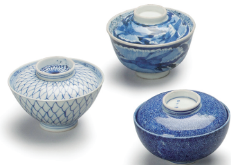
【蓋付き飯碗】 上: 鶴文様 中: 網目文様 下: みじん唐草文様